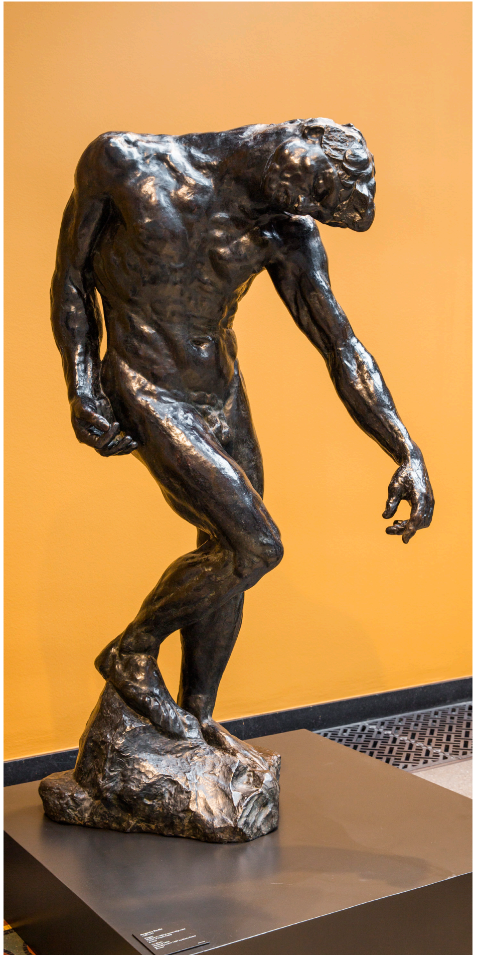
Auguste Rodin 1840-1880 Skyggen Modelleret 1880 Formodentligt støbt i 1927 af Musée Rodin Bronze