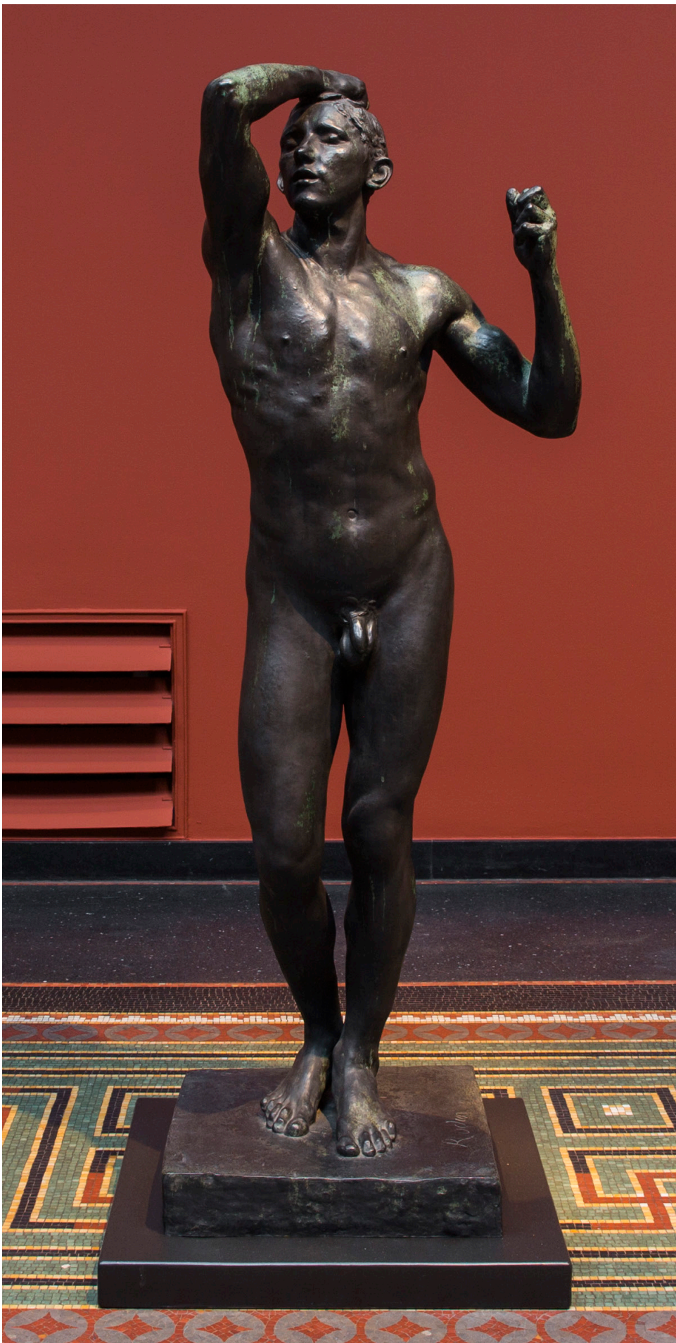
Auguste Rodin 1840-1907 Bronzealderen Modelleret 1875-76 Støbt 1901 Bronze