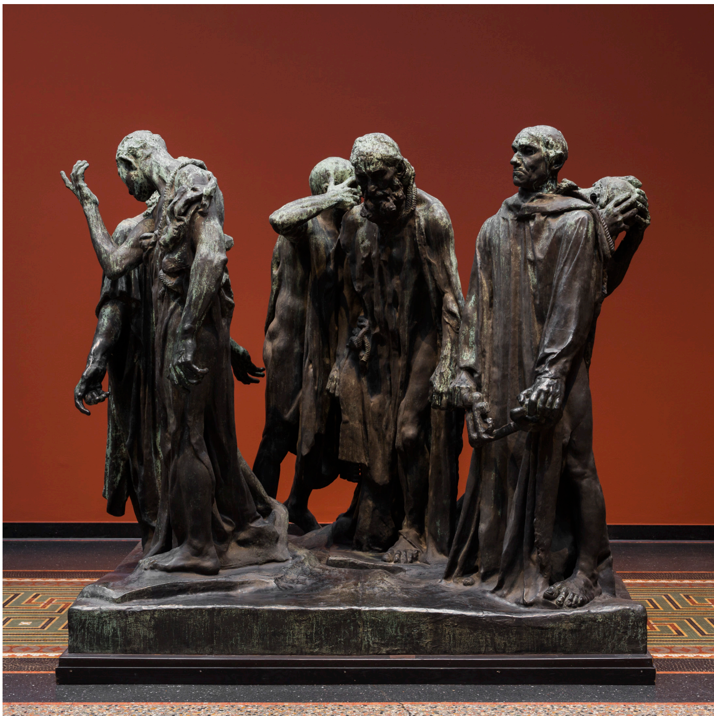
Auguste Rodin 1840-1907 Borgerne fra Calais Modelleret 1884-1895 Støbt 1902-1903 Bronze