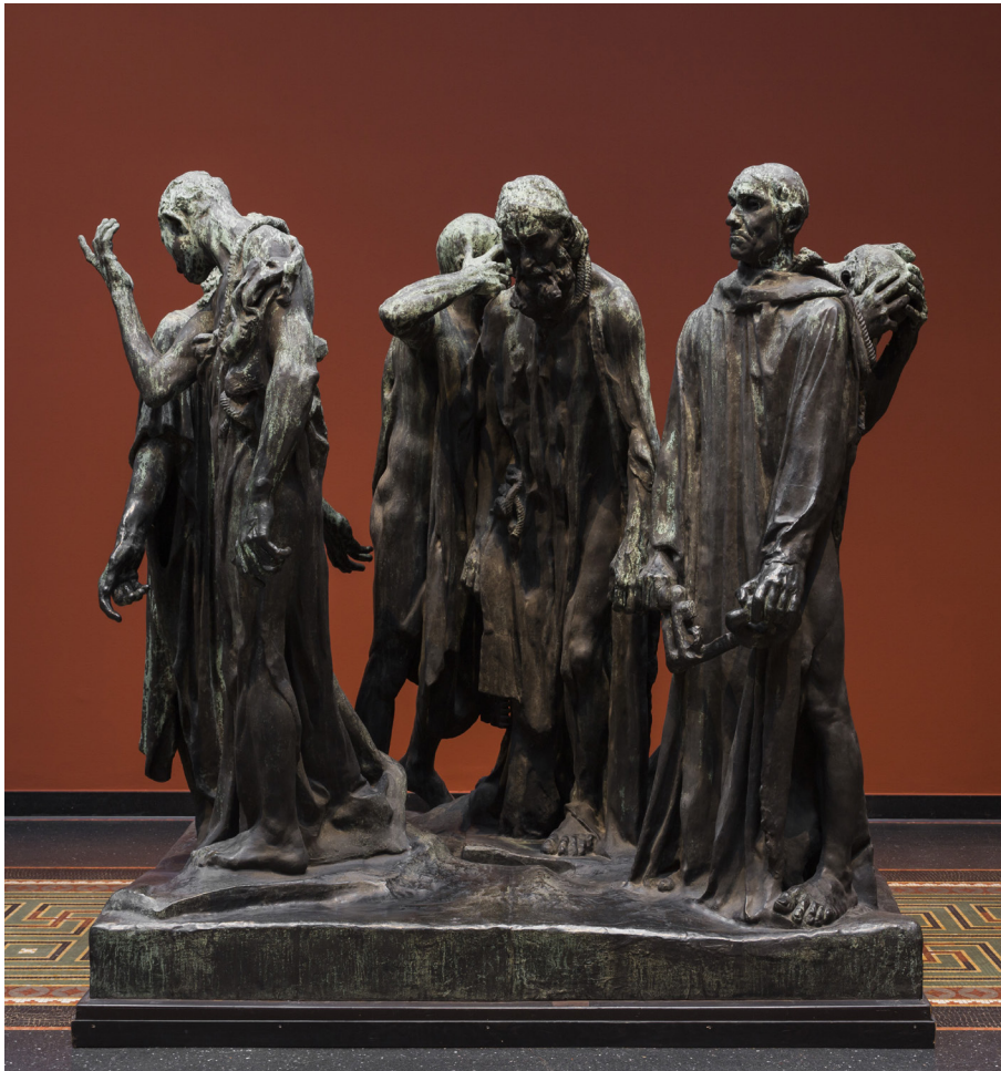
Auguste Rodin, Borgerne fra Calais , 1884-1895 (Støbt 1902-1903), Bronze, MIN 0608

Skriv en ny værktekst til skulpturgruppen Borgerne fra Calais . Overvej følgende: