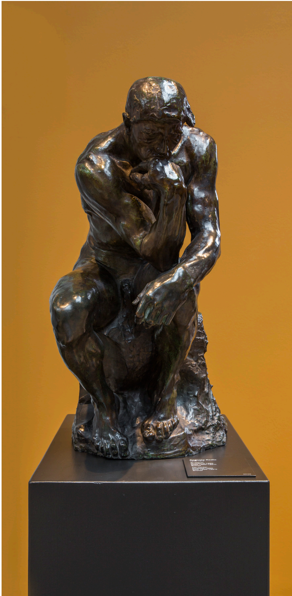
Auguste Rodin 1840-1917 Grubleren Modelleret 1880 (støbt 1900-1901) Bronze