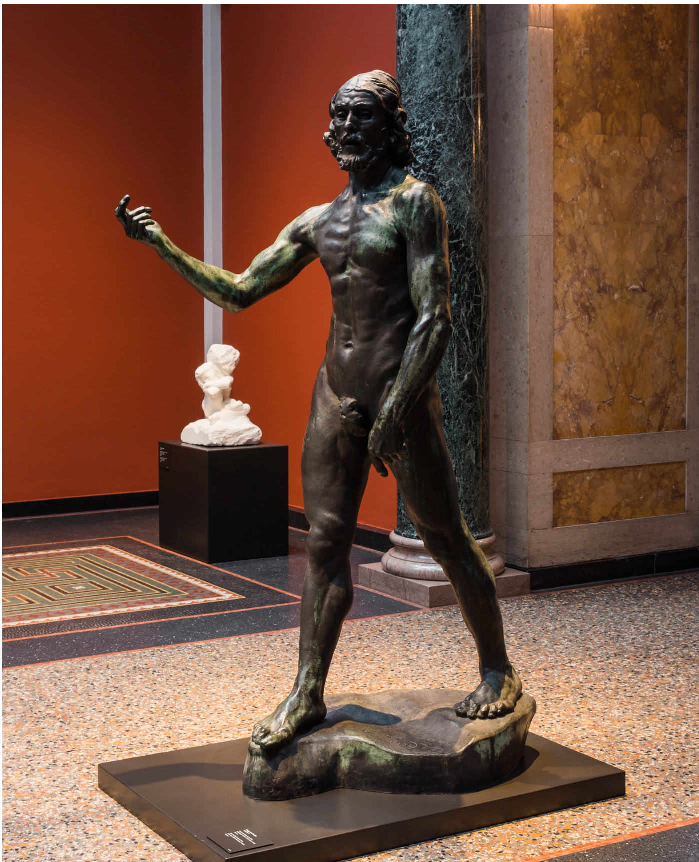
Auguste Rodin 1840-1907 Johannes Døberen prædiker Modelleret 1878-1879 Støbt 1902 Bronze