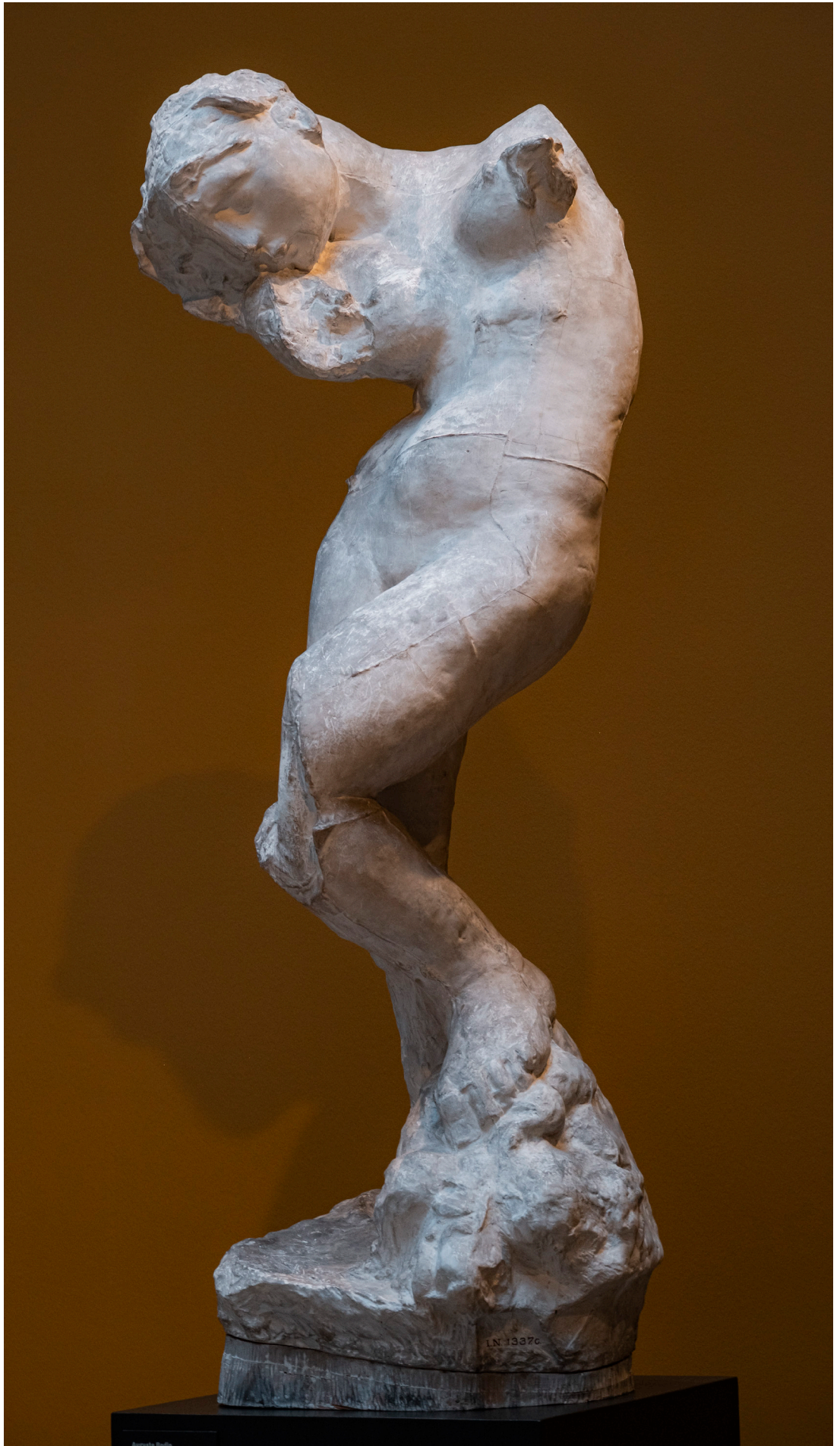
Auguste Rodin 1840-1907 Eftertanken Modelleret omkring 1896 Støbt 1902-1905 Gips