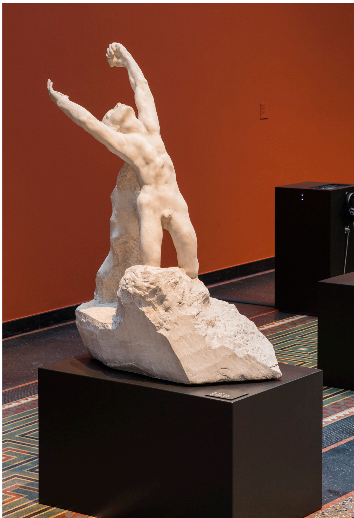
Auguste Rodin 1840-1907 Den fortabte søn Modelleret 1884 Hugget senest 1899 Kalksten