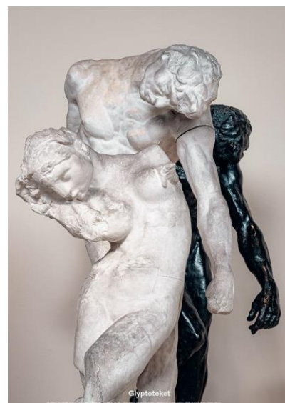
Auguste Rodin (1840-1917). Skyggen , Bronze, 1902. Gips, 1890.