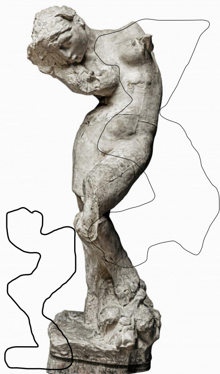
Auguste Rodin (1840-1917). Eftertanken , gips, 1889